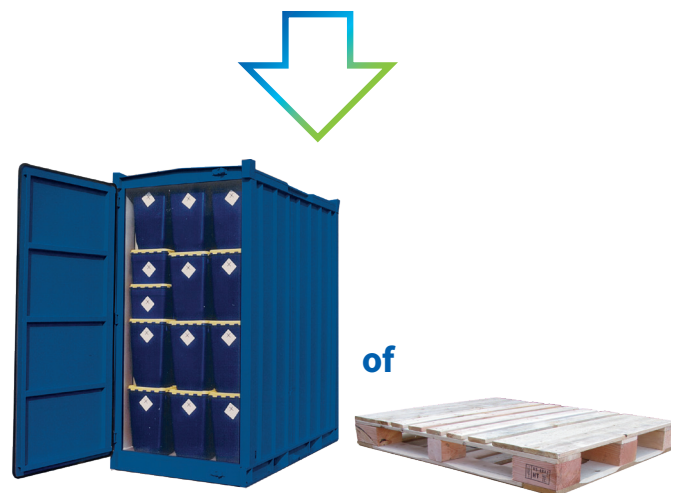
SZA cassette of op palet

NB: Is het afval mogelijk besmet door het Corona virus? Plaats dan een letter “C” aan alle zijden van het WIVA-vat, met stift of sticker.